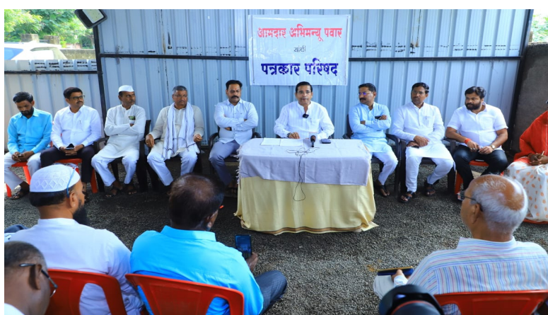
रुम, जीवन कौशल्ये प्रशिक्षण केंद्र, संस्कार केंद्र, खुली व्यायामशाळा, स्वच्छ व सुंदर शाळा, संगीत केंद्र, आर्ट गॅलरी, हरित शाळा व आत्मनिर्भर शाळा आशा विद्यार्थ्यांना उपलब्ध करून देण्यात येतील या उपक्रमांतर्गत प्रत्येकी एका शाळेवर किमान

सरकारी शाळांमध्ये शैक्षणिक सुविधा विकसित करणे. सैद्धांतिक शिक्षणाला प्रात्यक्षिक शिक्षणाची जोड देणे शाळा केंद्रीय विद्यालये, कॉन्व्हेंट शाळांच्या धर्तीवर विद्यार्थ्यांच्या चित्रकला, गायन, वादन, क्रीडा अशा विविध कलागुणांना वाव मिळवून देणे. पाठ्यक्रम शिक्षणसोबत जीवनावश्यक शिक्षणाच्या संधी उपलब्ध करून देणे. विद्यार्थ्यांना पाठ्यक्रमाबाहेरील शिक्षणाच्या संधी उपलब्ध करून देणे. शाळांना फिट इंडिया, स्वच्छ भारत, खेलेगा इंडिया जितेगा इंडिया इत्यादी अभियानांशी जोडणे. योग्य करिअर पाथ निवडण्यासाठी विद्यार्थ्यांना मदत करणे यासाठी औसा विधानसभा मतदारसंघातील प्रायोगिक तत्वावर दत्तक घेण्यात आलेल्या या जिल्हा परिषदेत शाळेत कॉम्प्युटर लॅब, सुसज्ज ग्रंथालय, विज्ञान व तंत्रज्ञान लॅब, क्रीडा केंद्र, स्मार्ट क्लास