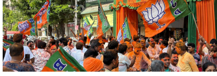
आणि कोलकाता येथील वॉर रूममध्ये बूथचा फीडबॅक थेट नेतृत्वापर्यंत २४ तास डेटा विश्लेषण करून प्रत्येक पाहोचवला जात होता.