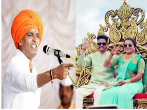
इंदुरीकरांचे ट्रोलर्सना सडेतोड उत्तर दिलंय.