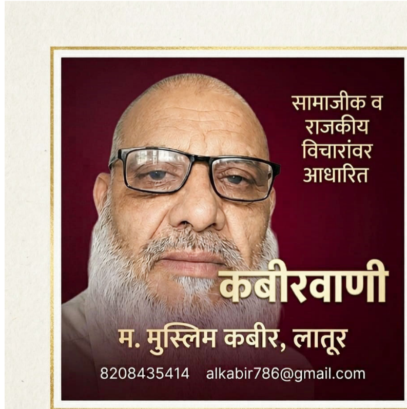
सामाजिक व राजकीय विचारांवर आधारित

हा संवाद महान संस्कार, दृढ ईमान आणि अल्लाहच्या निर्णयावर संपूर्ण समाधानाचे तेजस्वी उदाहरण आहे. एका बाजूला वडील अल्लाहच्या आदेशासाठी आपल्या सर्वात प्रिय वस्तूचा त्याग