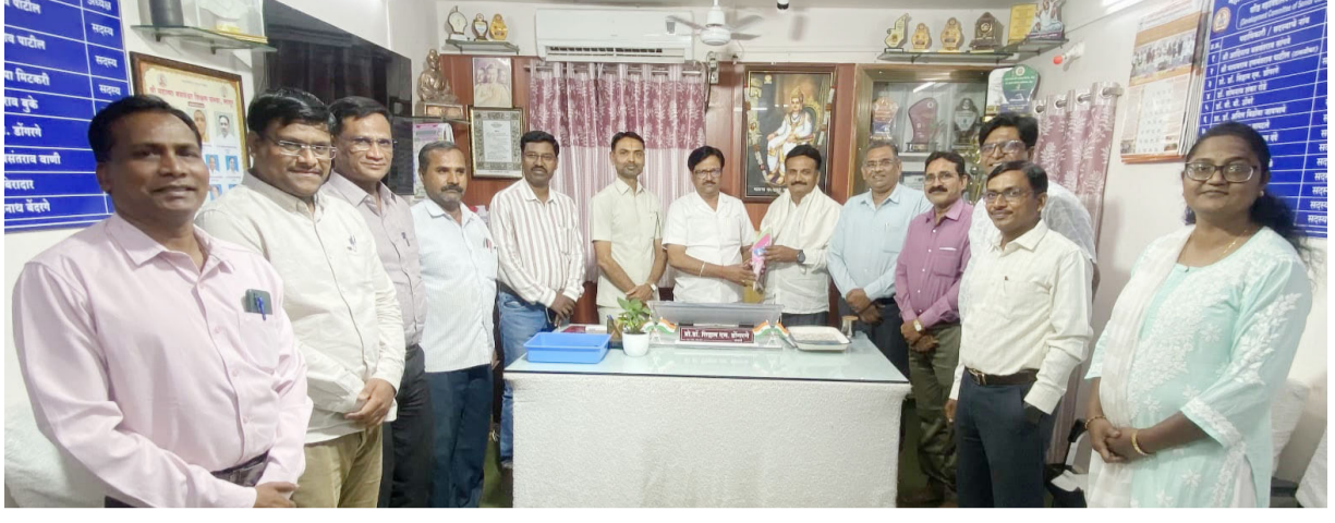
शिक्षकेतर कर्मचारी आणि विद्यार्थ्यांनी अभिन्नदंन करून पुढील वाटचालीस हार्दिक शुभेच्छा दिल्या आहेत.