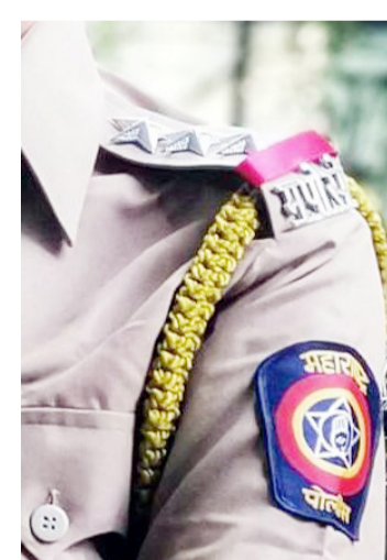
टिकाणे - औसा पोलीस ठाणे ४० ठिकाणे - निलंगा पोलीस ठाणे २६ ठिकाणे - उदगीर ग्रामीण पोलीस ठाणे २९ ठिकाणे - चाकूर पोलीस ठाणे ३१ ठिकाणे - एमटीदरम्यान नागरिकांच्या समस्या ऐकून घेण्याबरोबरच त्यांचे निराकरण करण्यासाठी संबंधित विभागांशी समन्वय

या उपक्रमात लातूर जिल्ह्यातील १० पोलीस ठाण्यांचा सहभाग असून एकूण ३१९ ठिकाणी भेटी आयोजित करण्यात आल्या आहेत. त्यामध्ये पुढीलप्रमाणे भेटी होणार आहेत : - उदगीर शहर पोलीस ठाणे ३३ ठिकाणे - गांधी चौक पोलीस ठाणे ३१ ठिकाणे - विवेकानंद चौक पोलीस ठाणे २६ ठिकाणे - शिवाजीनगर पोलीस ठाणे ३१ ठिकाणे - एमआयडीसी पोलीस ठाणे २६ ठिकाणे - अहमदपूर पोलीस ठाणे ४६ ठिकाणे