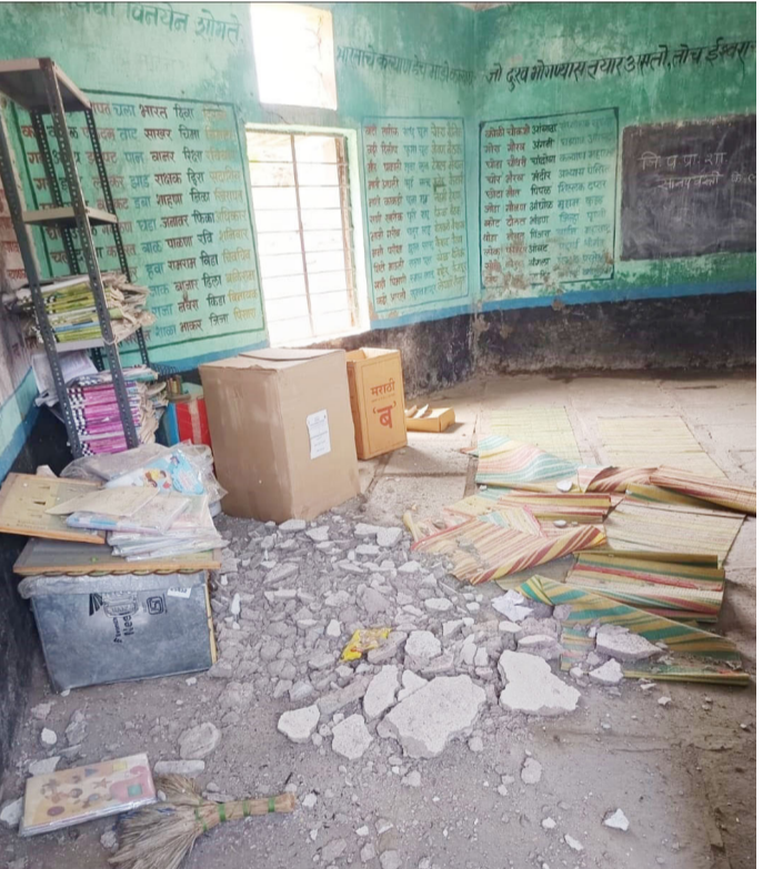
कारण शाळेची ही इमारत धोकादायक बनली असल्याने या शाळेची इमारत

आता मात्र पालकांमध्ये चिंतेचे वातावरण निर्माण झाले असून या ठिकाणी पालक आपल्या मुलांना शाळेत पाठवण्यास नकार देत आहेत.