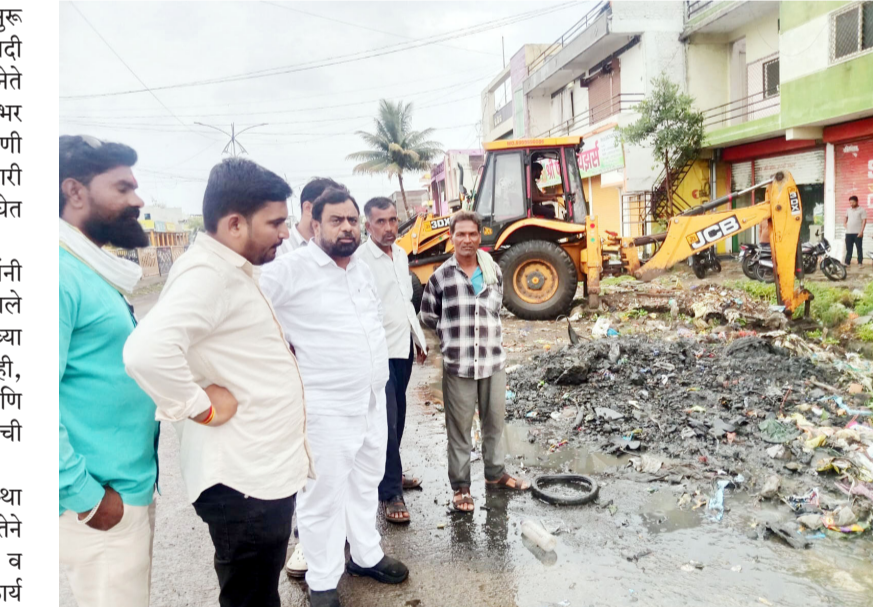
पाहणी करून व्यापारी व नागरिकांच्या समस्या जाणून घेऊन व्यापाऱ्यांच्या व नागरिकांच्या समस्या सोडविण्याचे कर्मचाऱ्यांना सूचना दिल्याबद्दल नागरिकांतून त्यांचे समाधान व्यक्त केले जात आहे.